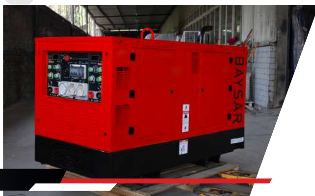
Двухпостовые сварочные агрегаты

Все дополнительные вопросы Вы всегда можете уточнить у Вашего персонального специалиста: